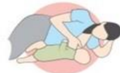
روش خوابیده به پهلوی

❖ رایج ترین روش شیر دهی روش گهواره ای است که سر نوزاد در خم آرنج قرار میگیرد و کف دست باسن نوزاد را حمایت میکند و با دست مخالف سینه را گرفته به صورت چهارانگشت زیر سینه و انگشت شصت روی سینه تا سینه از جلوی بینی نوزاد کنار زده شود تا راه تنفسی نوزاد باز باشد. در تمام روش ها روی نوزاد خم نمی شوید بلکه کاملاً به صندلی تکیه میدهید و نوزاد را بالاتر می آورید. و در تمام روش ها تمام هاله ی قهوه ای رنگ در دهان نوزاد قرار میگیرد و نباید صدای مکیدن از نوزاد شنیده شود. حجم معده ی نوزاد بعد از تولد بسیار کم و به اندازه ی یک گیللاس است پس در صورتی که نوزاد 20 دقیقه ی کامل سینه را مک زد سیر شده و میخوابد. از علائم سیر شدن نوزاد این است که او 2 تا 3 ساعت بعد از شیر دهی میخوابد و وزن گیری خوبی دارد در صورتی که نوزاد بعد از شیردهی کمتر از 2 ساعت میخوابد و وزنگیری کمی دارد میتوانید با مشورت پزشک از شیرافزا استفاده کنید.