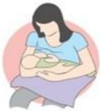
روش گهواره ای