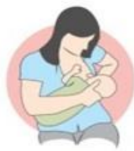
روش گهواره ای برعکس