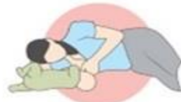
روش خوابیده به پهلوی برعکس