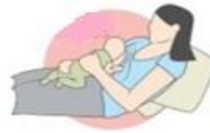
شیردهی به حالت خوابیده به پشت