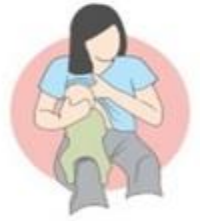
روش کمک آغوشی