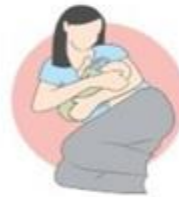
روش خوابیده به پهلوی گهواره ای